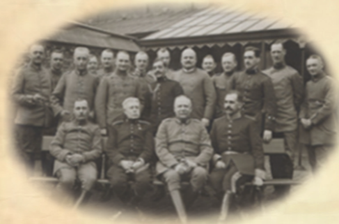
BCMM: MS-583 La comisión del general Luis de Santiago con los oficiales del Estado Mayor de la División alemana de Morseele (actual Mortsel, Bélgica), 1917. Sentado, el segundo por la izquierda, el general español

Al mismo tiempo, envía observadores para conocer y aprender de las experiencias de los ejércitos beligerantes. También hubo españoles que combatieron como voluntarios extranjeros en las trincheras.