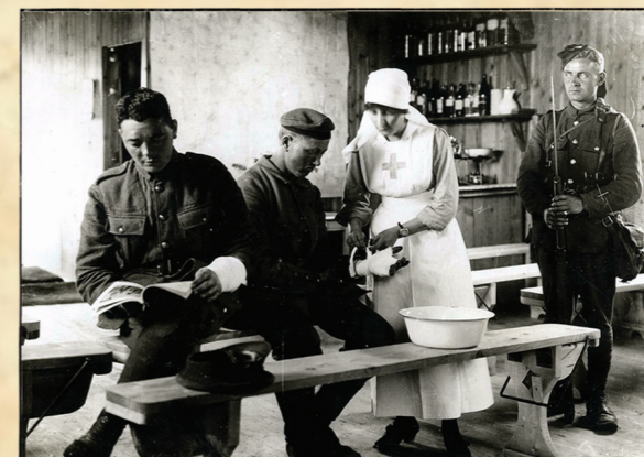
AGMM. F.047663. ERNEST BROOKS. Curación de un prisionero alemán en Abbeville, Somme (Francia), 22 junio 1917

Las distintas secciones de esta exposición muestran la visión de la Gran Guerra desde España y su situación en aquellos años; desde el inicio de la contienda en 1914, cuando se pensaba que terminaría por Navidad, pasando por el estancamiento de los frentes en la guerra de trincheras, hasta el desgaste general que provocó la crisis de 1917 y el desenlace con el Armisticio de noviembre de 1918, el fin de la guerra y los tratados de paz.