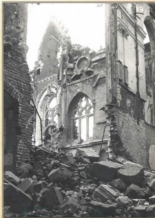
AGMM F.00318. SECTION PHOTOGRAPHIQUE DE L'ARMÉE. Ruinas del interior del Ayuntamiento de Arrás (Pas-de-Calais, Francia)

Las fotografías se acompañan y complementan con prensa procedente de la Hemeroteca Municipal de Madrid, libros de la Biblioteca Histórica Municipal de Madrid y piezas particulares.