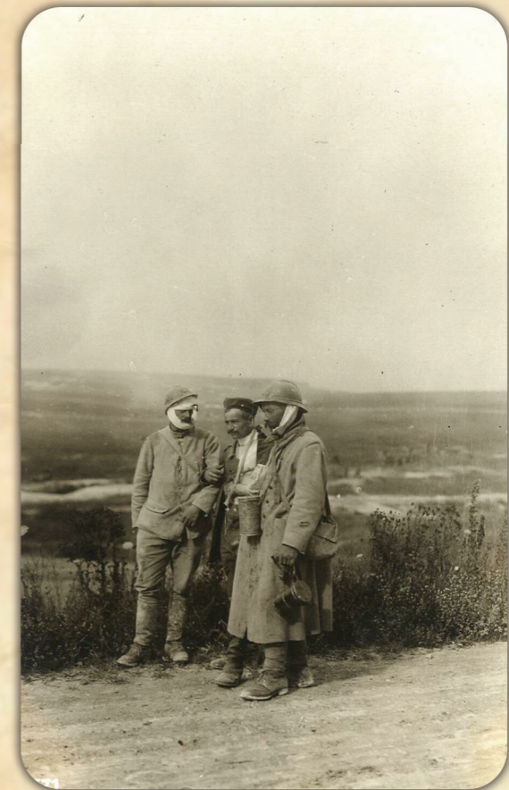
AGMM: F.00869. BuFA. Soldados alemanes y franceses se ayudan mutuamente en el camino de regreso, entre el Aisne y el Marne, julio 1918

FOTOGRAFÍAS DEL ARCHIVO GENERAL MILITAR DE MADRID