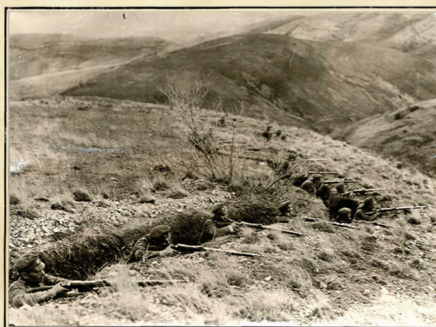
F.01767. Trincheras búlgaras en las montañas de Macedonia.

En la Gaceta del 7 de agosto de 1914 el gobierno de S.M. Alfonso XIII declaraba la neutralidad. Sensible a las necesidades de los combatientes y de sus familias, el ejército español colabora en labores humanitarias con la Oficina Pro-cautivos, creada por el Rey para encontrar a los desaparecidos en el frente, vigilar los campos de prisioneros y repatriar a los heridos graves.