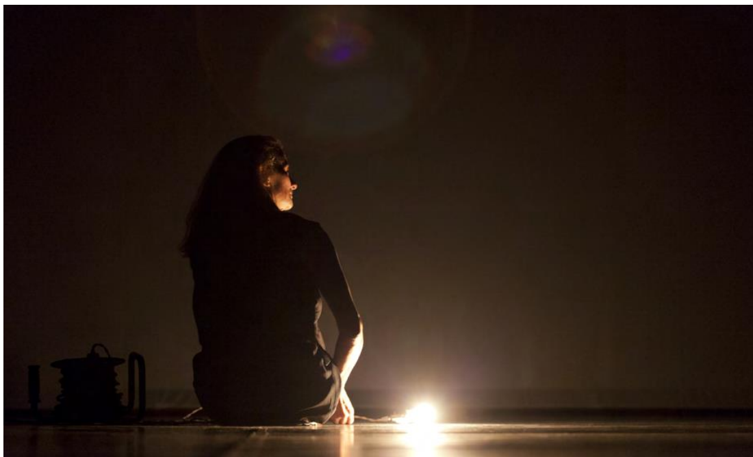
© JESUS ROBISCO – Episodios (Temporada 25)