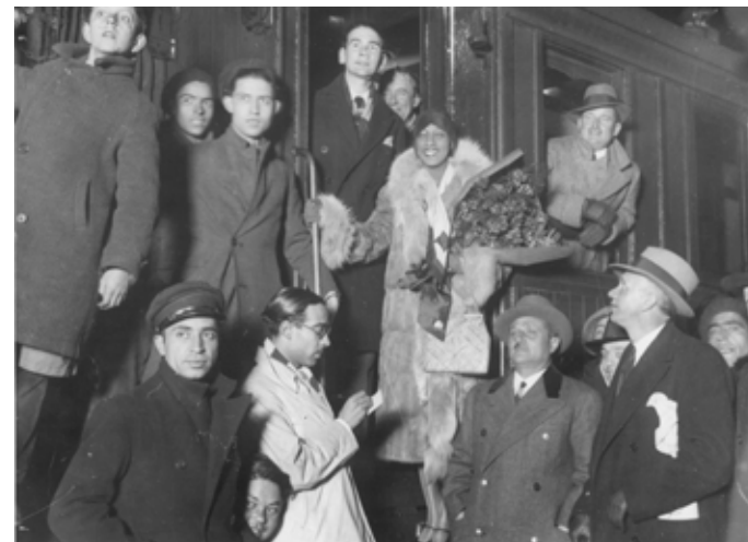
Josephine Baker a su llegada a la estación del Norte de Madrid en 1930.

A partir de los fondos gráficos y documentales del diario ABC