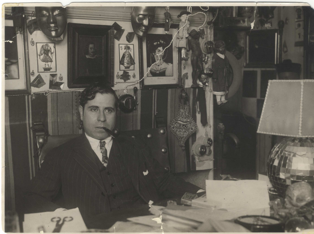
Foto: Ramón en su despacho.

Con motivo de la instalación permanente del Despacho de Ramón Gómez de la Serna (Madrid, 1888- Buenos Aires, 1963) en el Museo de Arte Contemporáneo de Madrid (MAC) se ha organizado el segundo ciclo de conferencias en torno a este artífice de la modernidad, continuando así el ciclo pasado Ramón y las ciudades . En esta ocasión sobre un aspecto específico de gran importancia en su literatura como es el eminentemente vanguardista, tanto de su obra, como sobre todo de su papel impulsor de las diferentes corrientes de lo Nuevo en la ciudad de Madrid.